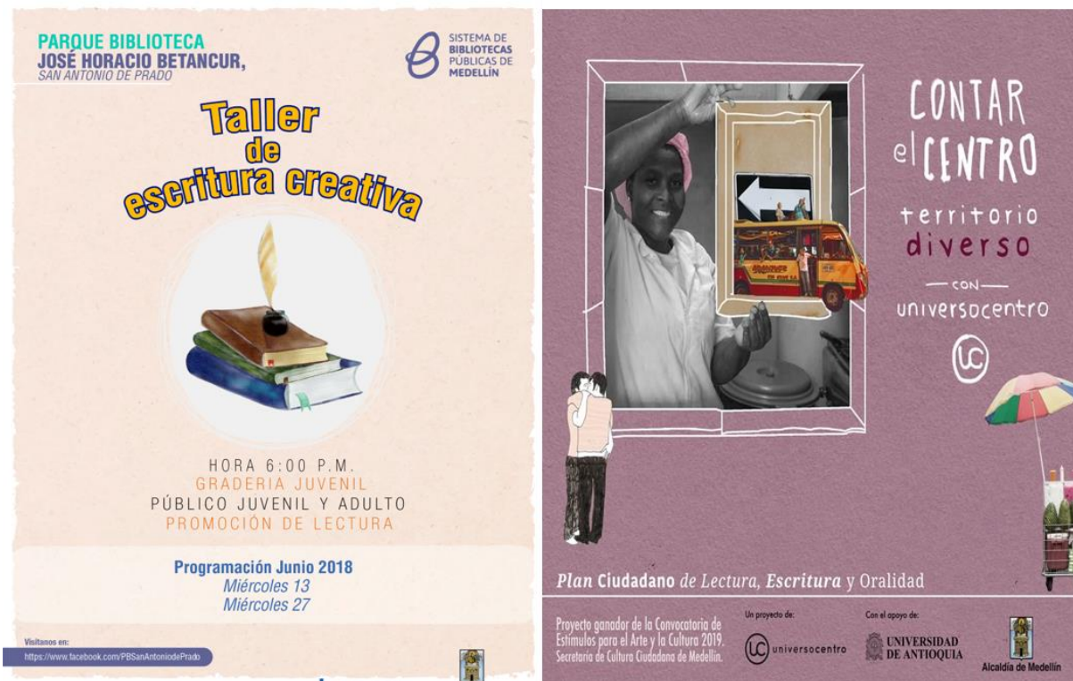
Figura 3. Carteles de los programas a los cuales invita el Plan ciudadano de Lectura,