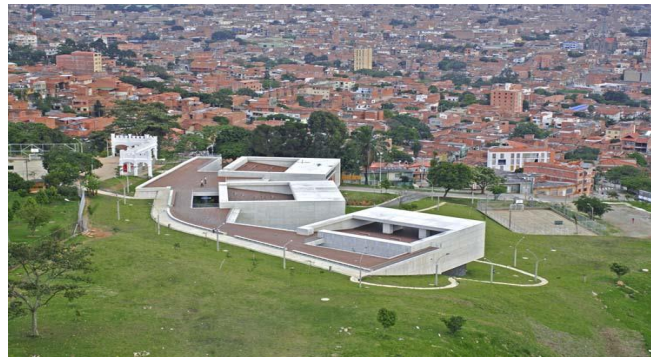
Figura 2. Parque Biblioteca Pública León de Greiff en Medellín