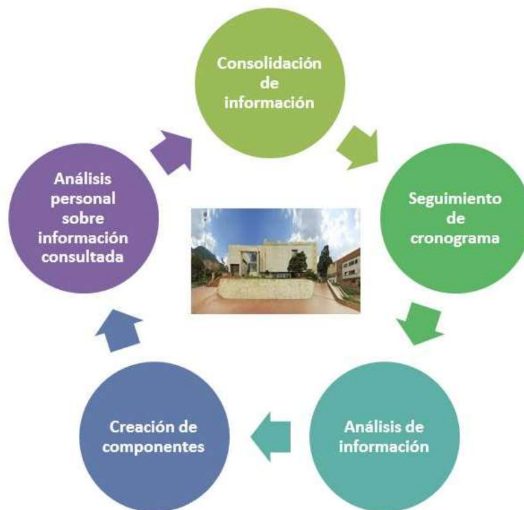
DISEÑO Y ESQUEMA GRÁFICO