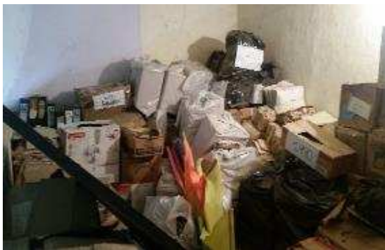
Fig. 1: Fondo Acumulado Alcaldía Municipal Alcaldía Municipal