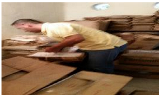
Fig. 5 y 6: Clasificación información.