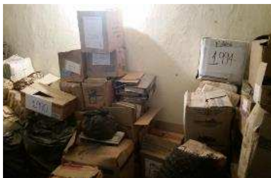
Fig. 2: Fondo Acumulado