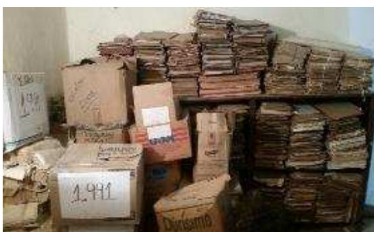
intervenir. Fig. 4: Clasificación documentación a intervenir.