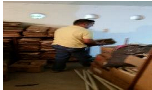
Fig. 7 y 8: Traslado Información área de trabajo FOVISORCA

Segunda Etapa – Distribución de Documentos por año de Emisión: Para esta etapa del proceso, se realizó una clasificación por año de vigencia de la información extraída del fondo acumulado (Actividad anterior del proceso) como resultado de este proceso se evidencio la existencia de información desde el año 1960 a 1999. Posteriormente se realizó una organización alfabética donde el punto de organización se tomó el primer apellido del propietario del predio (Ejido). Este procedimiento se realizó con la información de cada año clasificada con anterioridad. Este proceso de clasificación se ejecutó entre el 02 al 05 de Octubre de 2015, donde la jornada laboral fue la siguiente: