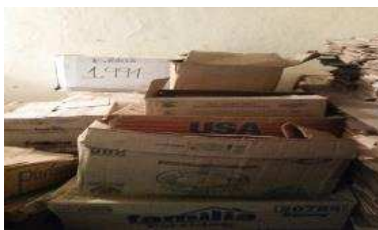
Fig. 3: Clasificación documentación a